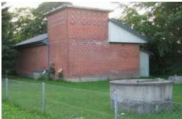
Foto: Vandværket, Lønbjergvej 4

Vi bringer her en kort information om vores vandværk, vand, og større projekter, som vi i øjeblikket arbejder med.